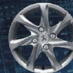
Jante aluminium 15" AZOTE