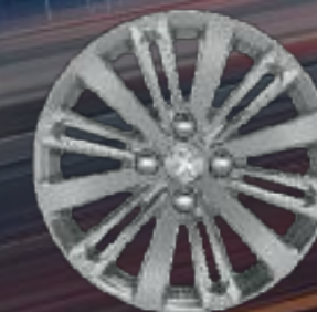
Jante aluminium 16" TITANE