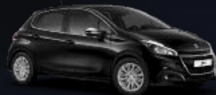
Noir Perla Nera