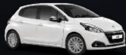
Blanc Perle Nacré